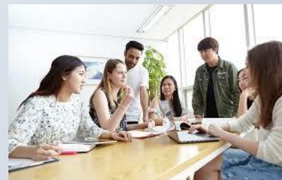
외국인 취업 상담