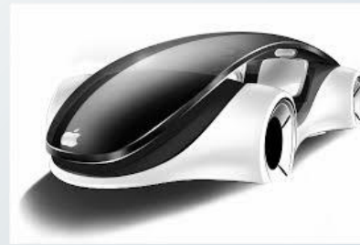
자동차 판매 상담