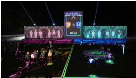
지역 브랜드 경험 공간개발

브릿지엑스는 다양한 타겟 시장을 통합하며, 고객과 수요처 간의 직접적이고 일관된 연결을 통해 높은 시장성을 지닌 플랫폼