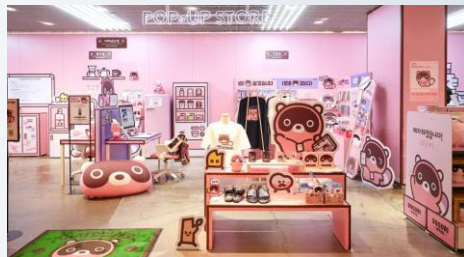
백화점, 쇼핑몰 프로모션